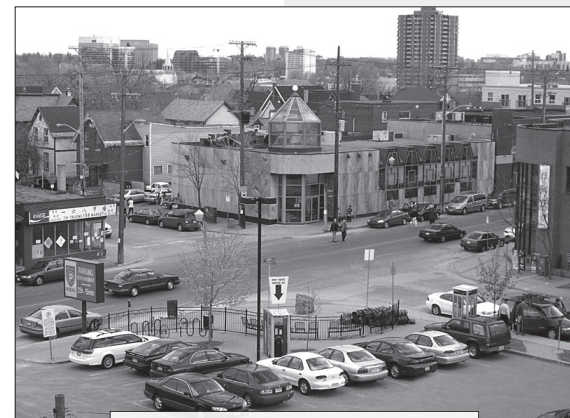
渥太華的唐人街是《號角》重點派發之地，當中的渥太華專頁，更成為當地華人接觸福音的重要橋樑。

一份報紙的成功在乎多方的付出，包括加東《號角》團隊的相助，以及本地義工的傾力參予，當然我們更需要讀者的支持及建設性的回應。期望未來五年，《號角月報》渥太華專頁更上一層樓，更多與大家分享神恩在加京。◎