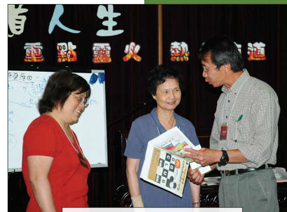
上圖：參加者學習如何與人接觸，向人傳福音。 下圖：出席佈道聚會的人數出乎意料之外，座椅一加再加。