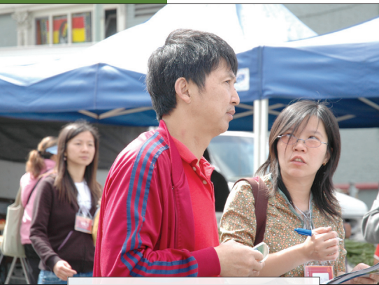
參加者每日下午都要走上街頭，實踐上午所學習的傳福音技巧。