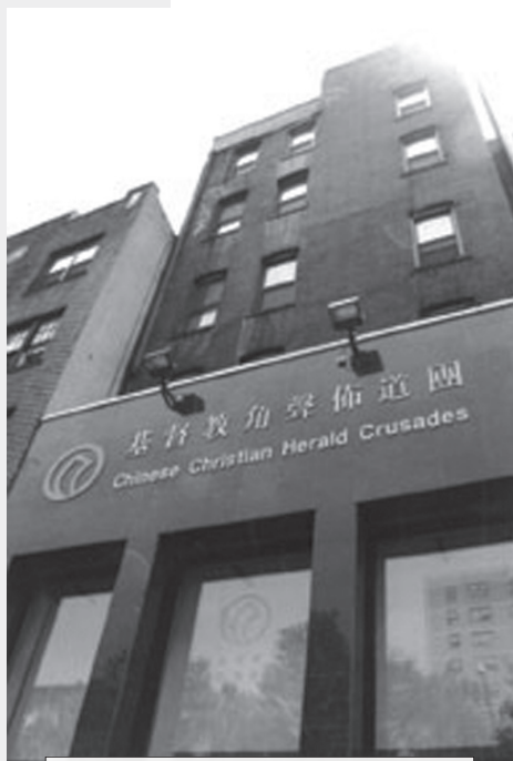
角聲大樓是一座獨立大廈，樓高七層，每層有二千方呎。只售九十八萬美元的樓價，可說是十分理想。