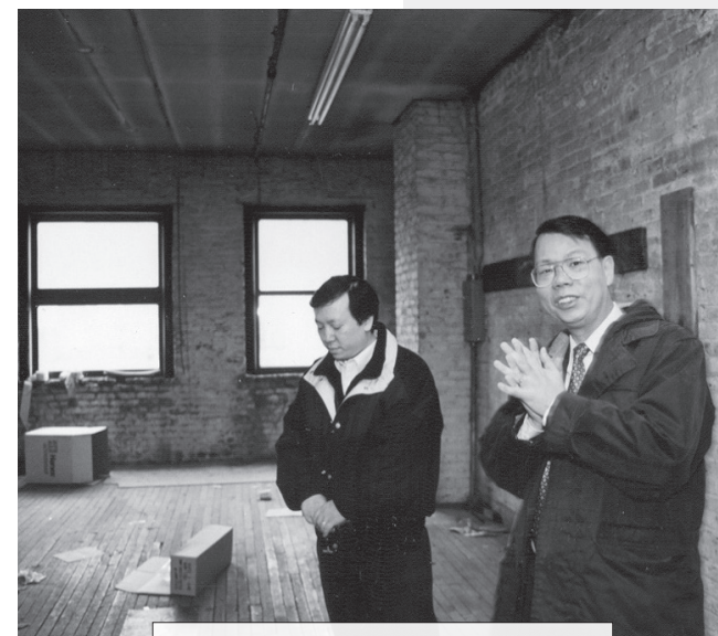
當日購址時，該物業的內部是個貨倉，需要花七十萬美元的裝修費用，才變成合用的角聲大樓。

在這期間，有許多人給予大大小小的支持，也有姊妹開數小時的車送來數萬元免息貸款；也有老人家用他們的積蓄支持了數萬元，其中有奉獻數千，數百或數十元的…這都讓我十分感動。有一對夫婦，本來用低息貸款方式支持，但後來他們覺得角聲既是屬神的工作，神給他們恩典那麼多，怎可以向神拿回利息呢？於是便改為免息貸款。相信神會悅納他們的心意；事實上，這對夫婦後來還雙雙進修神學，作了宣道士。