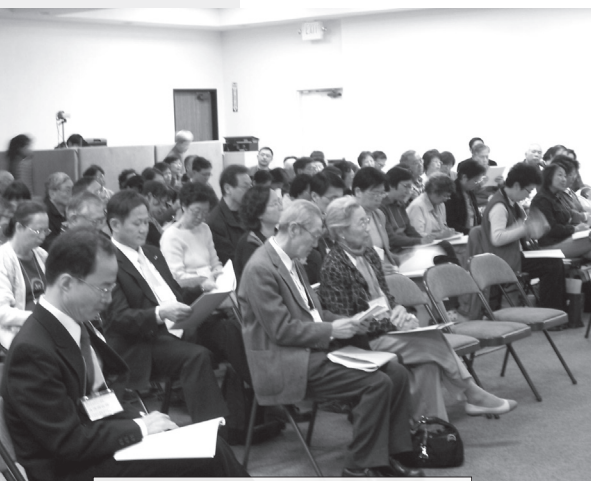
150多位華人聚集在基督之家第三家，探討生命末期的全人關懷。

剛 從研究所畢業的我，卻常被人誤以為還是大學新生。這樣的我，怎麼也想不到因著加入角聲癌友關懷網作義工，而參與了10月27日角聲癌友關懷網與北美路加醫療傳道會合辦的「舊金山灣區華人教會生命倫理研討會」，探討一個好像不是我這個年紀群的人會認真思考的話題：「安樂死的爭議及生命末期的全人臨終關懷」。那天從多位醫護專業人員，教牧長者的教導中，所聽所學造成了我心中不小的震撼。（註：當天講座的錄音可從角聲癌症網站cancer.cchc.org下載聆聽）