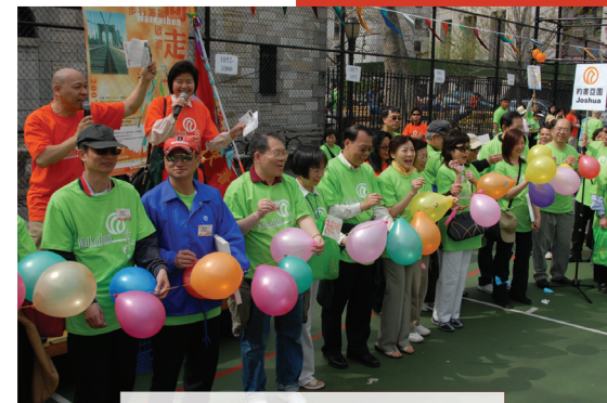
主禮嘉賓齊齊爆破氣球，在這別開生面的開步禮後，步行立即開始。

有關這次「關懷社區，同走一程」的短片及圖片，可瀏覽下列網址： www.youtube.com/watch?v=YVJYwX8RtAM 及 www.cchc.org/walk @