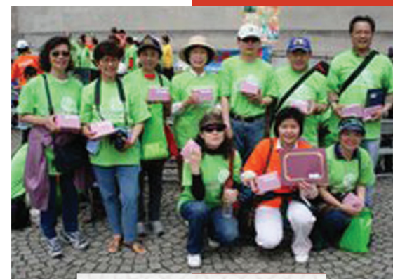
中華歸主紐約教會獲團體籌款冠軍。其隊員又得到個人籌款亞軍。