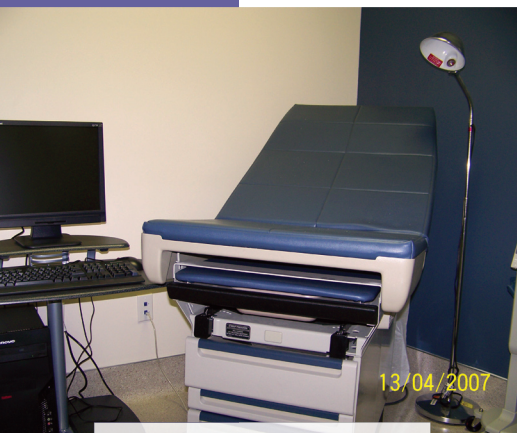
上圖：醫療中心內的醫療器材大致已預備妥當。 下圖：這是中心為病人提供的牙醫治療設備。

6月29日，也就是第八天，晚上約十時，我收到了一通電話，是我教會一位當助理醫生的弟兄打來的。他告訴我在主日崇拜中聽分享診所的事情，他願意成為其中的一位。這通電話，就把10·10·10的印証完成了。那天晚上，我整夜難以入睡。