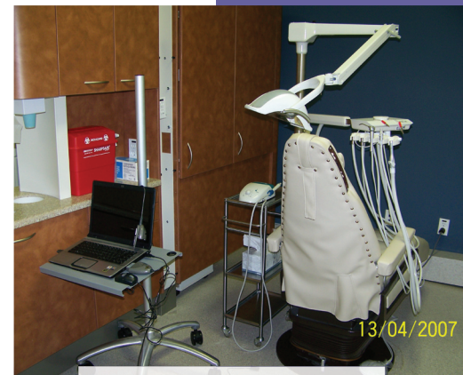
醫療中心第一期設備現已裝設妥當。當日的異象，今日逐步實現。