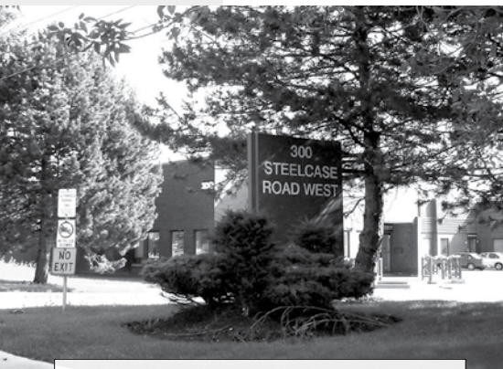
籌購中的加拿大角聲新址，座落工業地段，難得單位外環境綠樹成蔭，尚算雅緻。

親愛的弟兄姊妹： 加拿大角聲籌購新址，雖有不少有心人相助，但仍未籌足廿八萬加元之數。只要有一千人，每人奉獻280加元，即可成事，請多多支持及代禱。如果神感動你，奉獻支票抬頭請寫：CCHC，逕寄：CCHC (Canada) Herald Monthly, 3325 Victoria Park Ave., Suite 205, Scarborough, ON, Canada M1W 2R8